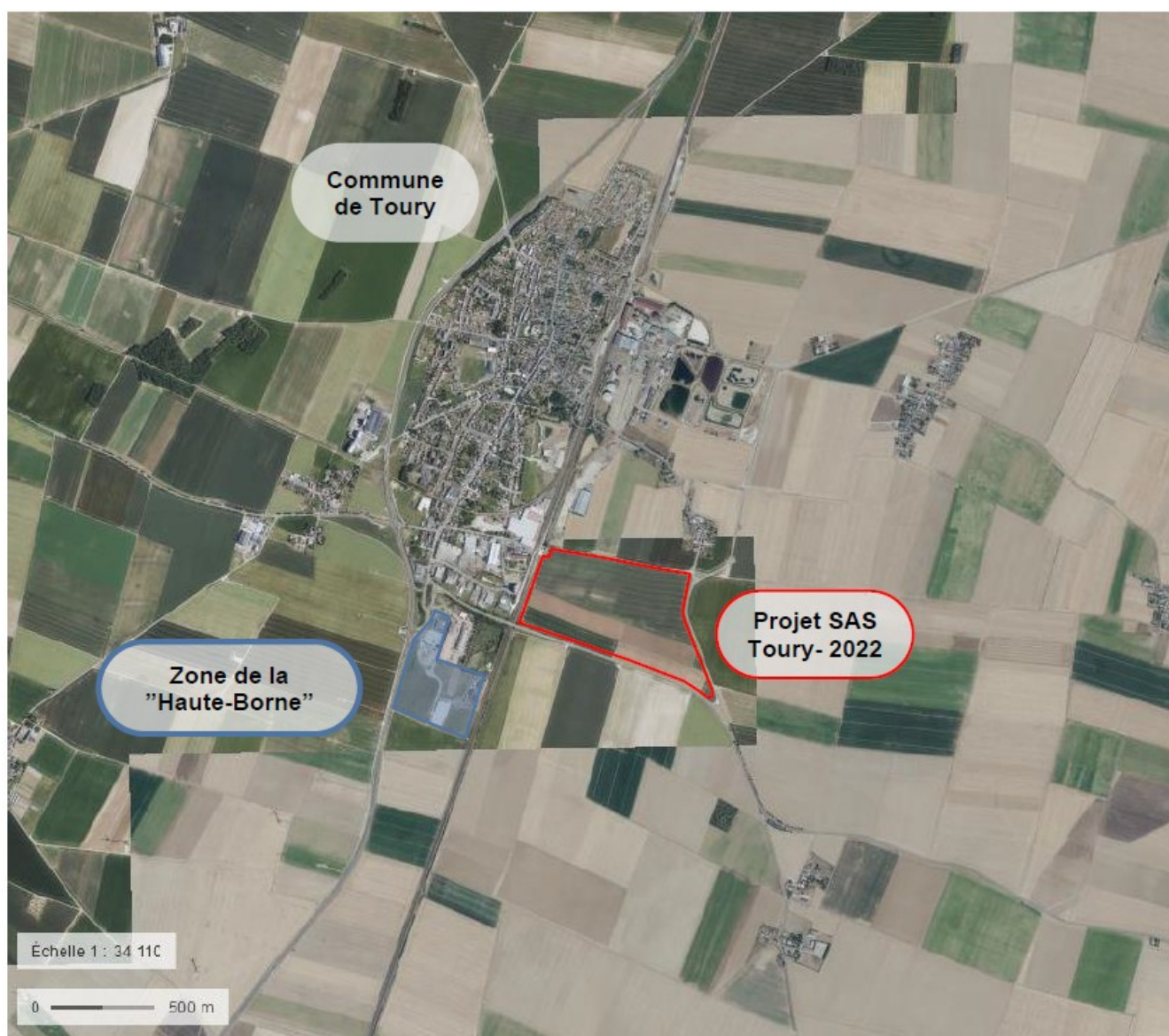
Localisation du projet global de plate-forme

La mise en service des bâtiments A et C est prévue à l'horizon 2024 et 2025 pour le bâtiment B.