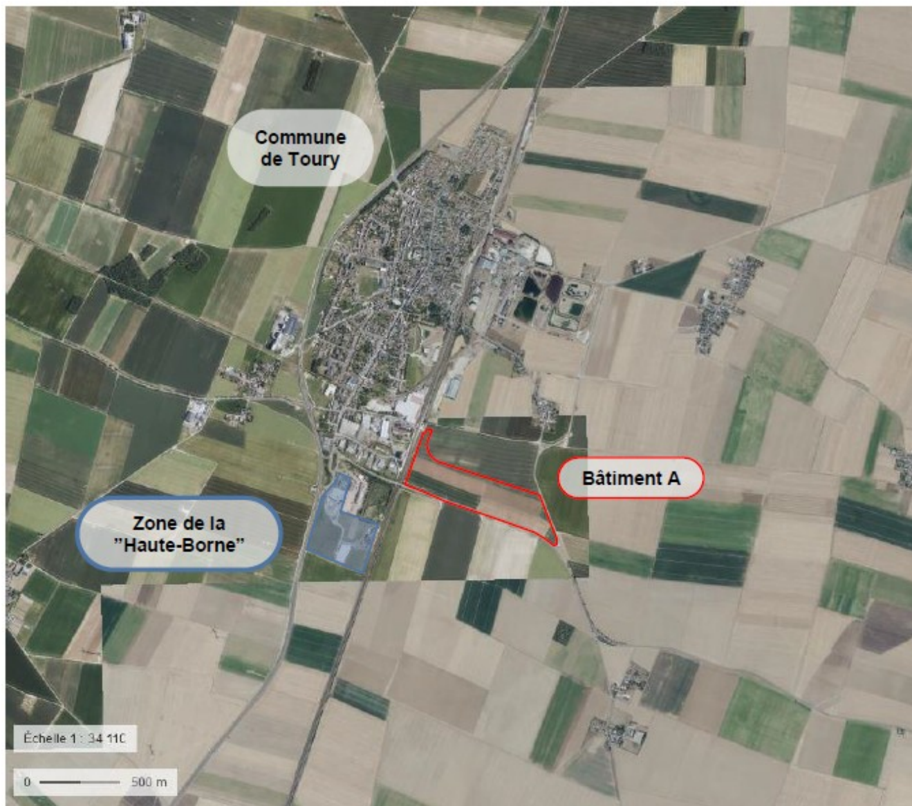
Localisation du bâtiment A (source : note de présentation on technique, page 4)

Les trois bâtiments prendront place sur des terrains agricoles représentant une superficie totale d'environ 37 ha. La surface totale du terrain d'emprise du bâtiment A est de l'ordre de 20,5 ha. Le bâtiment d'une surface plancher d'environ 8,6 ha est destiné à accueillir des produits combustibles courants vendus en grande distribution. Des aménagements de création de voiries, de parking et d'ouvrages pour la gestion des eaux seront également réalisés. Le reste du terrain sera réservé aux espaces verts.